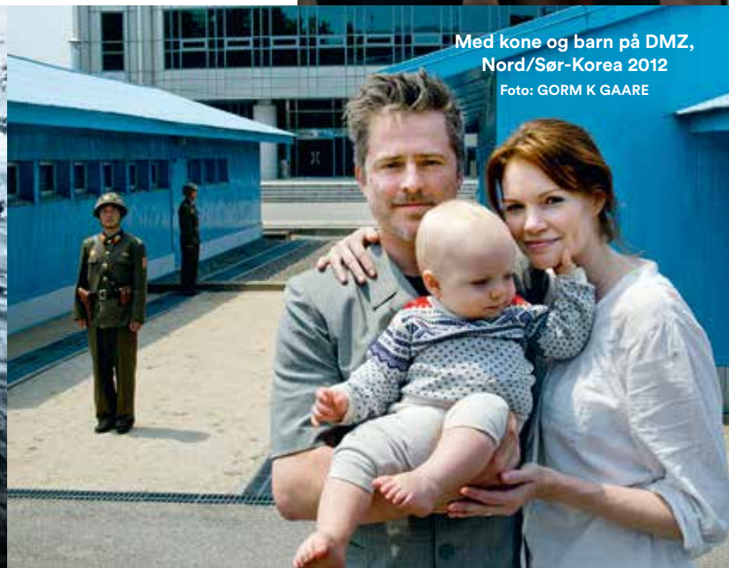
Med kone og barn på DMZ, Nord/Sør-Korea 2012