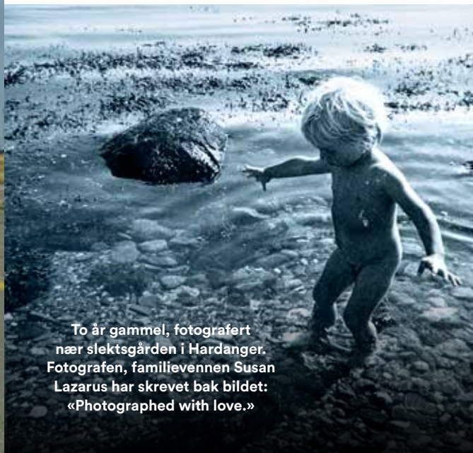
To år gammel, fotografert nær slektsgården i Hardanger. Fotografen, familievennen Susan Lazarus har skrevet bak bildet: «Photographed with love.»