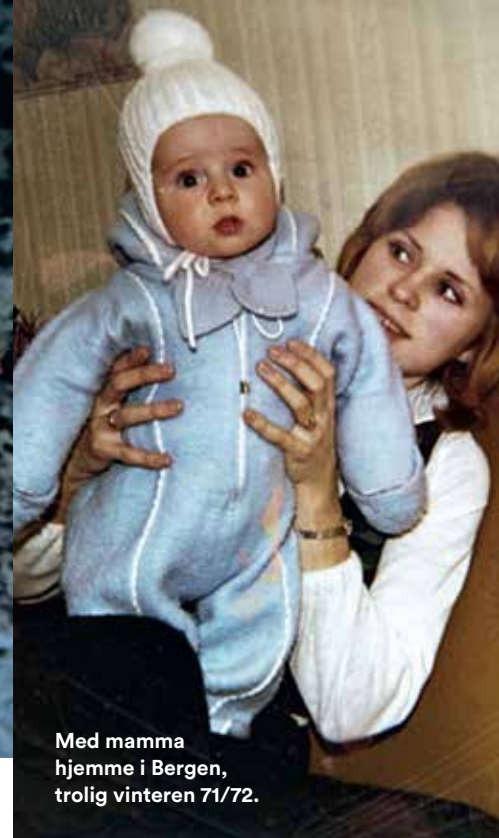
Med mamma hjemme i Bergen, trolig vinteren 71/72.

Traavik arrangerte de første Norske Festspill i Nord-Korea, Pyongyang 17.mai 2012.