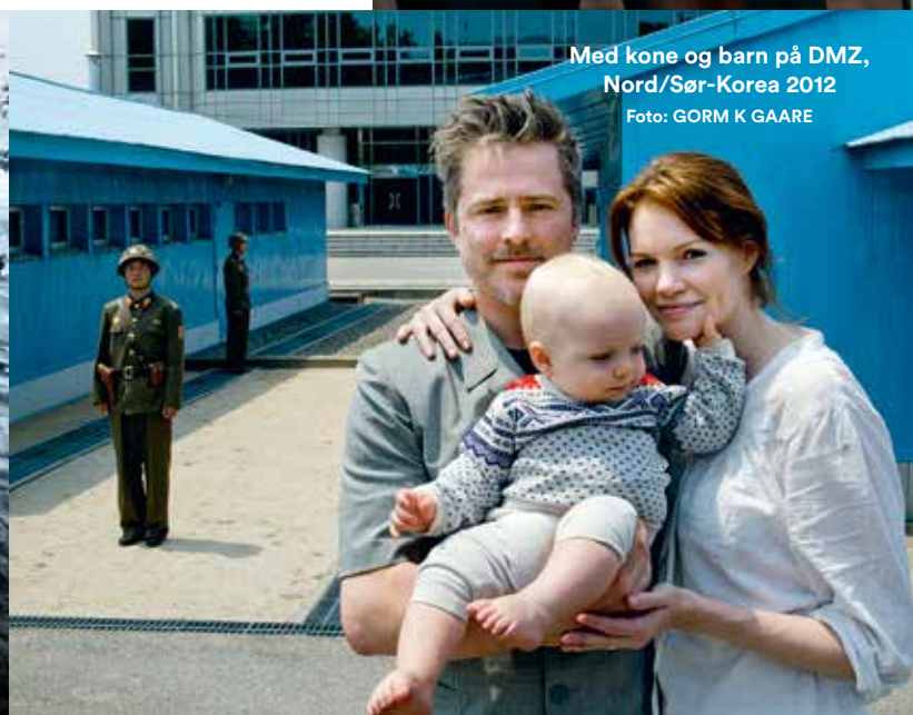
Med kone og barn på DMZ, Nord/Sør-Korea 2012