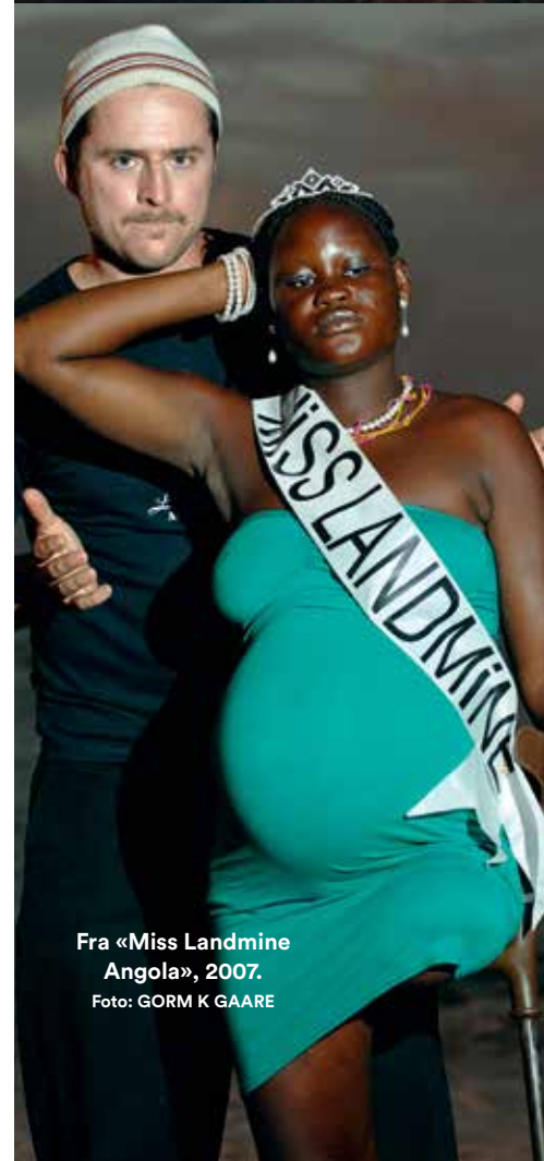
Fra «Miss Landmine Angola», 2007.

LIVET TIL NÅ: – Jeg synes jeg hadde en veldig bra barndom og ungdom, med en livskrise rundt 30. Jeg fikk rett og slett en kjempedepresjon. Ikke noe annerledes enn mange andre 30-årskrises, men jeg mistet helt troen på meg selv og det jeg holdt på med og ... det aller meste. Jeg måtte avbryte teaterforestillingen jeg holdt på å regissere, sykmelde meg, finne på noe helt annet i et par år. Da holdt jeg ikke på med kunst i det hele tatt, faktisk. I et par år jobbet jeg som portør på Rikshospitalet. Det er denne klisjeen om livskrisen som viser seg å være en blessing in disguise. En av mine store skrekkscenarier i livet frem til da var å mislykkes offentlig. Å bli avslørt. Og jeg tror det var utrolig viktig nettopp å oppleve det, oppdage at livet går videre og at du overlever. Så ble livet etter hvert veldig mye bedre igjen, og egentlig bedre enn det noen gang har vært.