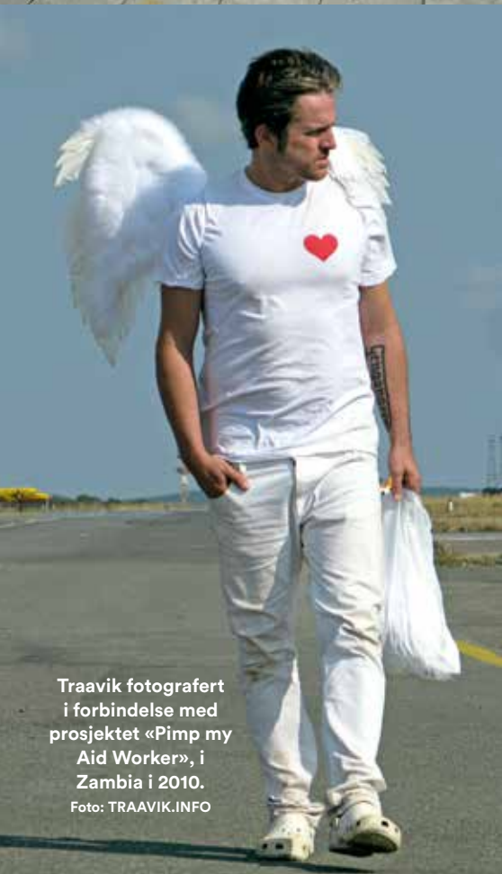
Traavik fotografert i forbindelse med prosjektet «Pimp my Aid Worker», i Zambia i 2010.