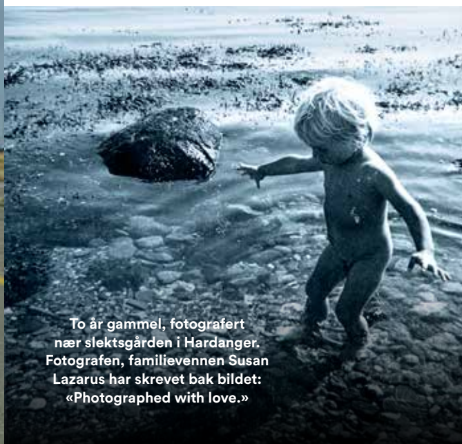
To år gammel, fotografert nær slektsgården i Hardanger. Fotografen, familievennen Susan Lazarus har skrevet bak bildet: «Photographed with love.»