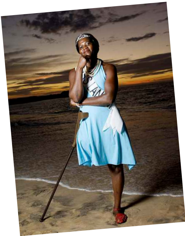
OMDISKUTERT: «Miss Landmine Angola» er et både bejublet og utskjelt kunstprosjekt som fikk mye oppmerksomhet. Mineofre stilte altså opp i skjønnhetskonkurranse. Her er Miss Huila.