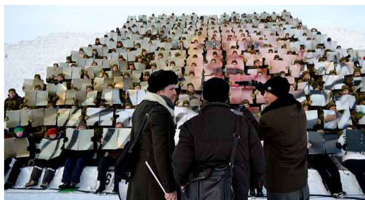
OGSÅ KONTROVERSIELT: Også hans Nord-Korea-prosjekter er omstridte. Her i Kirkenes.