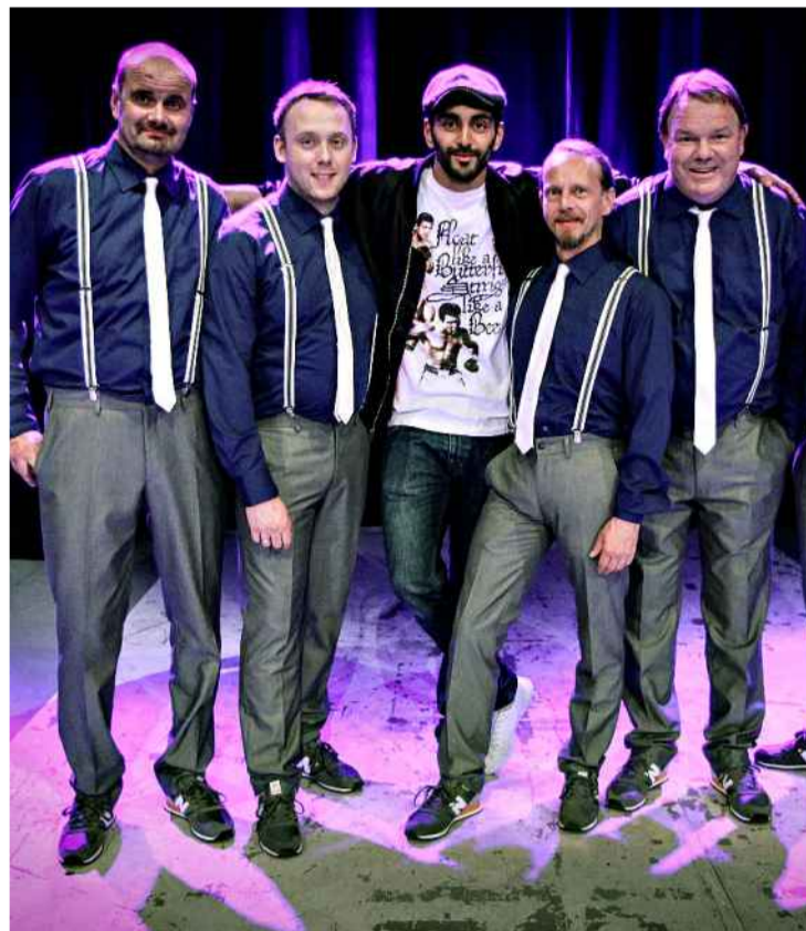
HEFTIG BEGEISTRENDE: Å se Adil Khan lære en gjeng stive arbeidskarene å danse, er så festlig at kjendisene i «Skal vi danse» blekner. Heia folk flest!