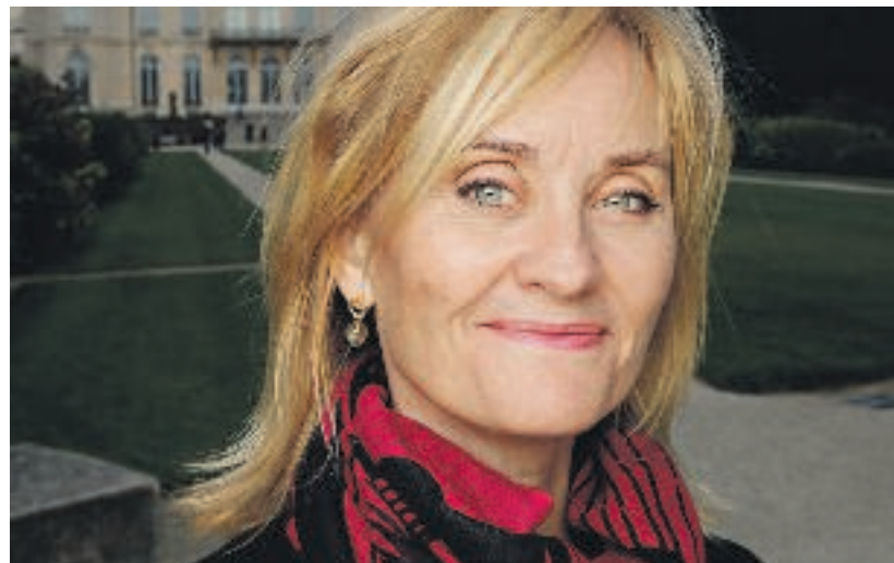
HISTORIE: Hege Duckerts bok tar for seg objekter som illustrerer historiske forandringer.

Om dette er en faktisk person eller om det er en sammensatt skikkelse bygget på flere, er ikke helt klart. Det er iallfall et psevdonym, og i boka blir han en fin, menneskelig kontrast til de gitte bildene av landet – glisende ledere, utpinte konsentrasjonsleirfanger, hungersnød og jerndisiplinerte barn i vanviddets masseopptrinn. Her er det mange forræderier.