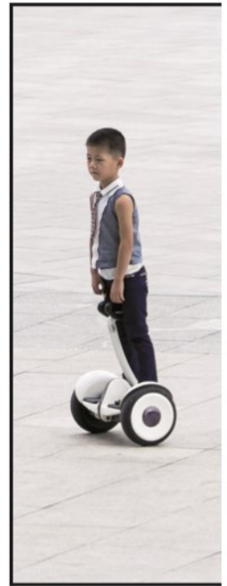
SEGWAYEN: ...har også kommet til Nord-Korea.