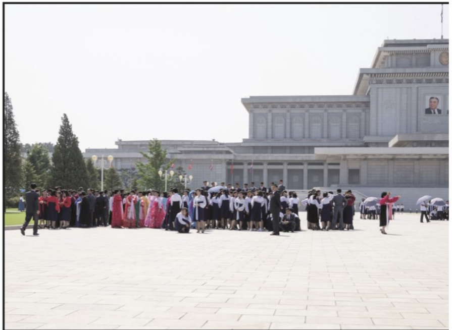
MAUSOLEUM: Fra utsiden av Kumsusan Sun's Palace (mausoleet der Kim Il Sung og Kim Jong-Il ligger balsamert). Det var ikke i hagen.