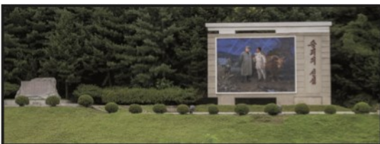
HYLLER LEDERNE: Bildet er tatt fra bussen på vei til Mt. Myohyang.