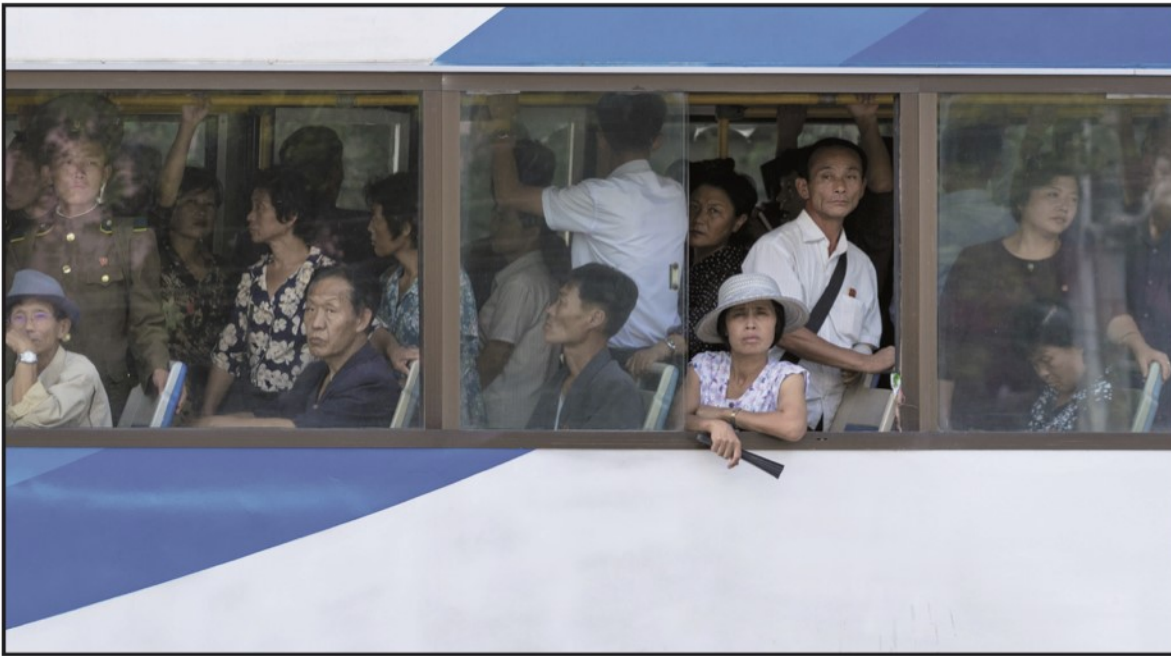
MER TRAFIKK: Det er blitt mer biltrafikk i Pyongyang siden Lena var der første gang i 2012. Men bussene er fortsatt det mest brukte fremkomstmiddelet for folk flest. I tillegg går de fleste, eller tar seg frem på sykkel eller elsykkel til og fra skole og jobb.