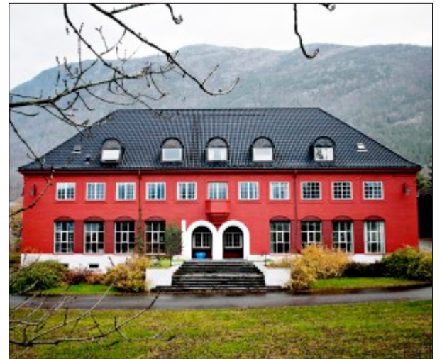
SENTRAL I ÅLVIK: Messen er teikna av Ålvik-arkitekten Nicolai Beer og stod ferdig i 1925.

Messen, som tidlegare var kontorbygning for Bjølvefossen i Ålvik, skal seljast. Det betyr at Ålvik-kunstnarane går ei usikker framtid i møte.