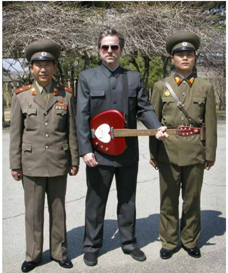
Traavik har bragt elementer fra vestlig pop-kultur til Nord-Korea og nord-koreanske uttrykk til Norge. Kulturrådet har støttet mye av arbeidet.

sosialdemokratisk statsminister sier han vurderer å sende militæret til forstedene for at de skal slutte å bombe politistasjoner der. Da går det ikke lenger an å fornekte at de kanskje har tatt inn en del folk de ikke burde. Men det måtte liksom komme dit.