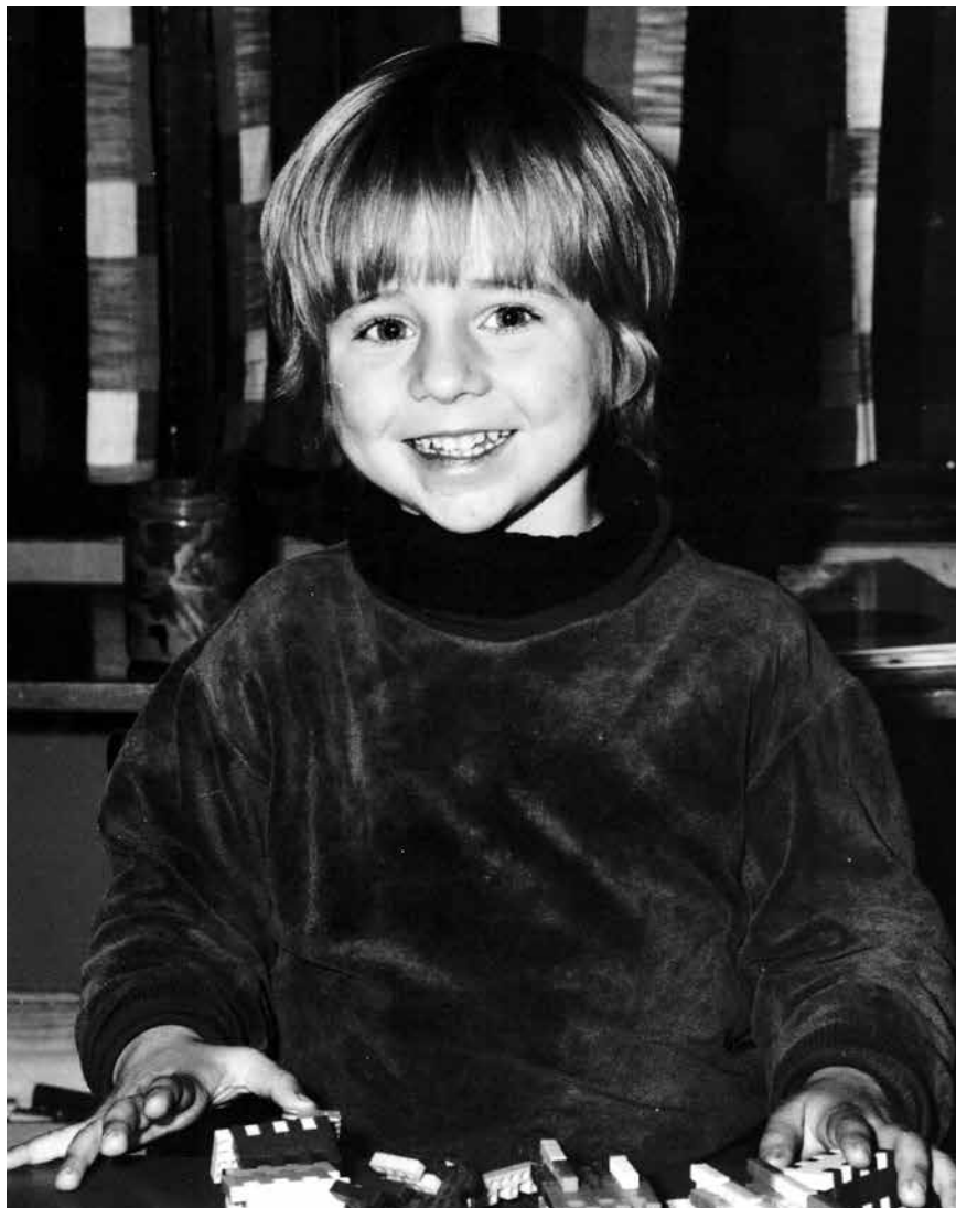
Allerede etter noen dager i barnehagen begynte unge Traavik å instruere de andre barna i små oppsetninger, sier familiehistorien.

«Metoo er som de fleste revolusjoner, det startet med at noen svin fikk som fortjent, men ender som en heksejakt på annerledes tenkende.»